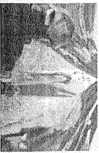
Los trabajos avanzan en el drenaje sanitario de la colonia.

Por su parte el Alcalde Encarcelado Benito Rangel Villalpando, señaló que es importante que se continúe trabajando a favor de la mejora de la infraestructura sanitaria en la zona y que se siga trabajando para mejorar la calidad de vida de la colonia Colinas de La Morena y la zona.